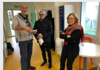
Ouest France 9/05/2019

Les bénévoles accueillent les familles avec le personnel de GEPSA, le gestionnaire délégué du CPH.