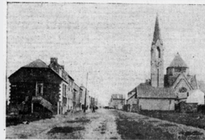
Une vue de la rue Bigot-de-Prémeneu et de l'église Saint-Thérèse.